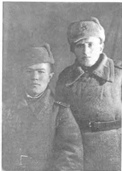
Память десантной службы и фронтальной жизни в Карелии