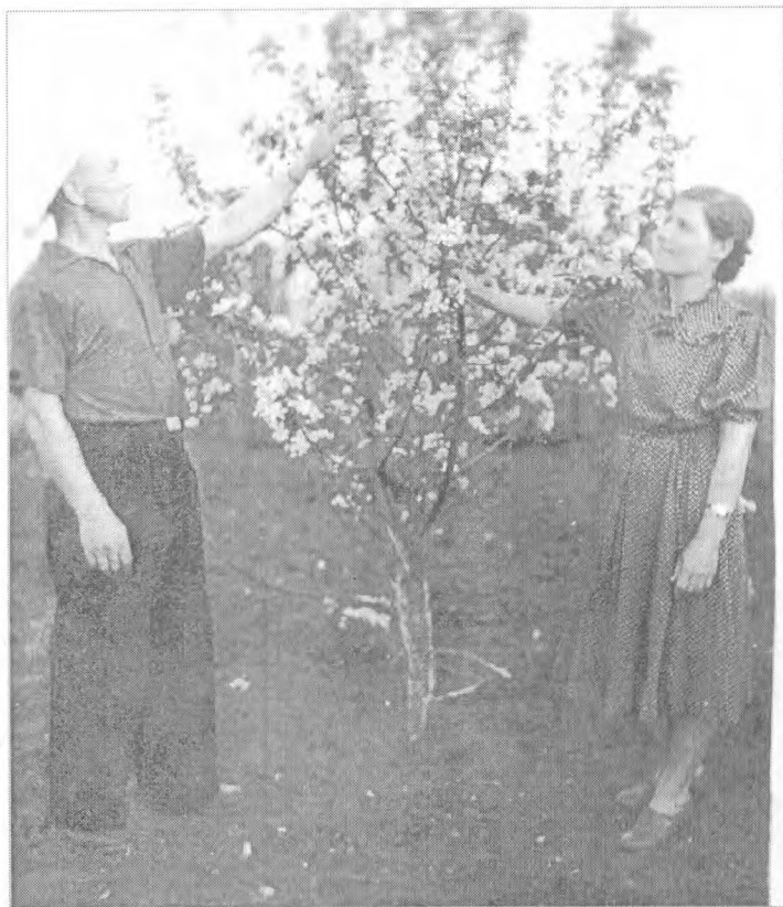
В своём саду