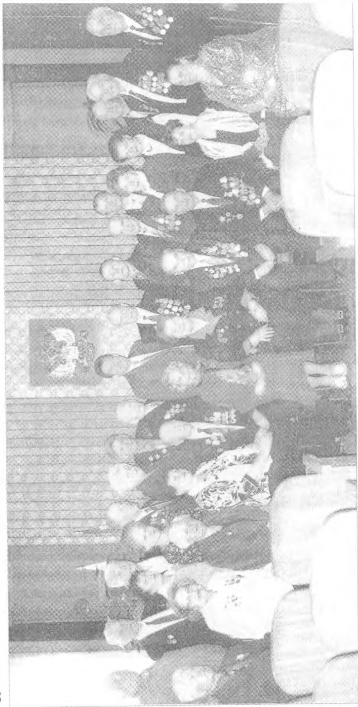
Ветераны – активисты на приёме у Главы города