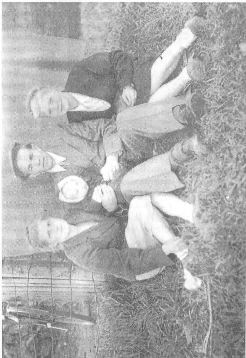
В кругу семьи