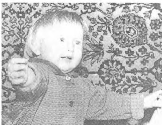
Дочь Светлана в двухлетнем возрасте