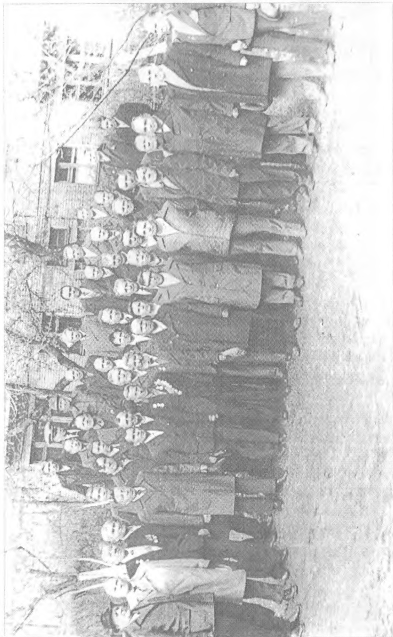
Ветераны партии, войны и труда у комбината шахты